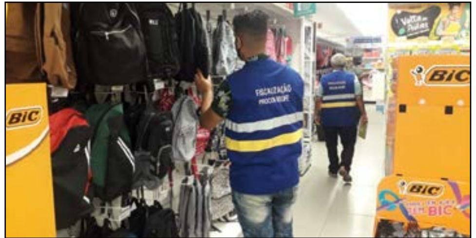
Diferença de preços em alguns itens pesquisados chegou a 332%