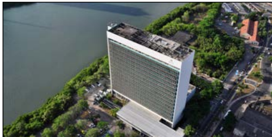
O Investe Recife é o elo entre potenciais investidores e o poder público municipal

prorrogada por igual período. As contratações temporárias terão prazo de dois anos, passíveis de prorrogação por prazo igual.