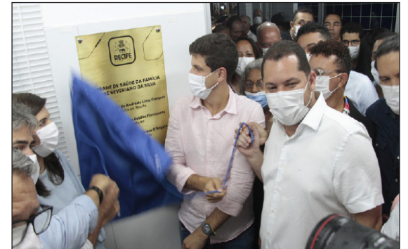
Prefeito João Campos e Romerinho Jatobá descerram placa da requalificação da unidade

José Severiano, foram investidos pela Prefeitura do Recife, ao todo, R$ 911.938,42. Entre as intervenções realizadas, estão aplicação de revestimento cerâmico em todas as paredes; pintura interna e externa; troca de portas, janelas, telhado e forro de gesso; readequação das salas de vacina, curativo e coleta, de acordo com as normas sanitárias; entre outros serviços. Entre os procedimentos ofertados na unidade estão: consulta médica; atendimento de enfermagem; consultas odontológicas; acolhimento na saúde; vacinação; dispensação de medicamentos; coleta de exames.