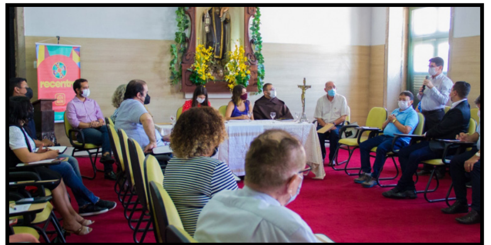
Principais eixos do projeto de revitalização do Centro do Recife foram apresentados durante reunião com párocos e freis

PROGRAMA RECENTRO - Coração econômico, histórico e cultural do Recife, os bairros do centro da cidade convivem com a movimentação do comércio, com a inovação do parque tecnológico e agitada vida cultural, mas também com os desafios construídos ao longo de muitos anos. Para pensar o desenvolvimento dessa área de maneira integrada e explorar toda sua potencialidade, a Prefeitura do Recife lançou, em novembro de 2021, o Programa Recentro. A iniciativa prevê um grande plano de manutenção, de cuidado, de incentivos fiscais para os