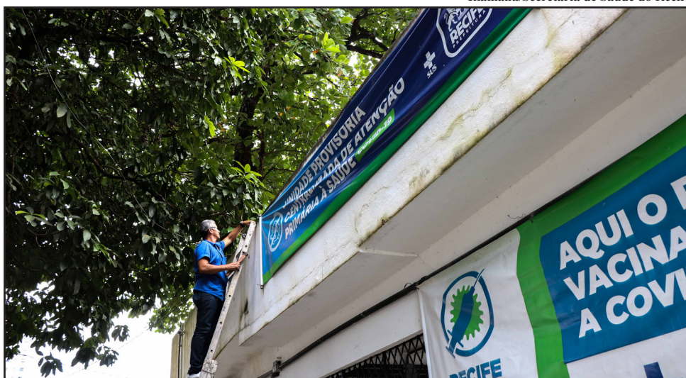
No momento mais crítico da pandemia, a capital chegou a contar com 22 Unidades Provisórias Centralizadas da Atenção Básica (UPC-AB)

A queda dos indicadores da pandemia e o amplo processo de vacinação anticovid na cidade também foram fatores levados em consideração