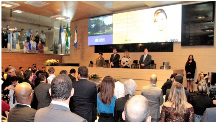
Profissionais receberam o Prêmio Mérito de Comunicação Jornalista Graça Araújo