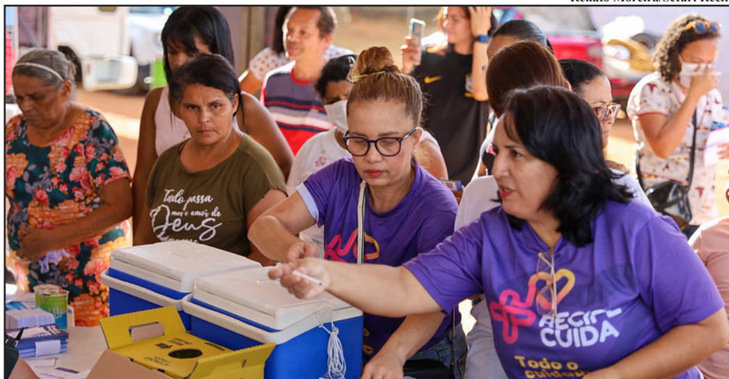
O evento ocorrerá das 15h às 20h, promovendo lazer gratuito para todas as idades