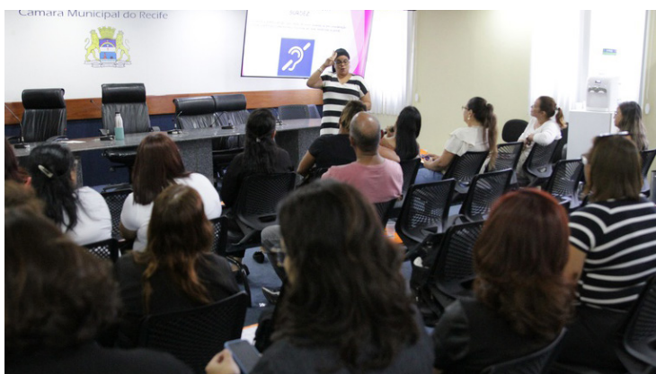
Escola do Legislativo promove atividade para servidores

Compartilhar informações para aumentar a inclusão no local do trabalho e melhorar o atendimento ao público. Com esse objetivo, a Escola do Legislativo do Recife deu início à Oficina de Vivências Inclusivas, nesta quarta-feira (16), no plenarinho da Câmara Municipal do Recife. O evento é destinado aos servidores da Casa e conta com palestras ministradas por