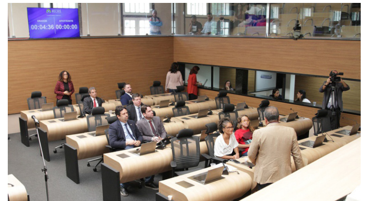
Vereadores exaltaram o Dia do Professor falando sobre desafios e conquistas

mencionou personalidades políticas ligadas a essa área e lembrou a aprovação de uma emenda parlamentar de sua autoria para a execução de novos projetos em educação, especialmente no âmbito da primeira infância. “Ser professor e professora em um país como o Brasil, acima de tudo, é um ato de amor e de coragem, porque se abdica de uma série de questões para ensinar os nossos filhos e formar as novas gerações”.