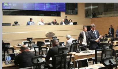
Vereadores discutem temas relevantes para a cidade